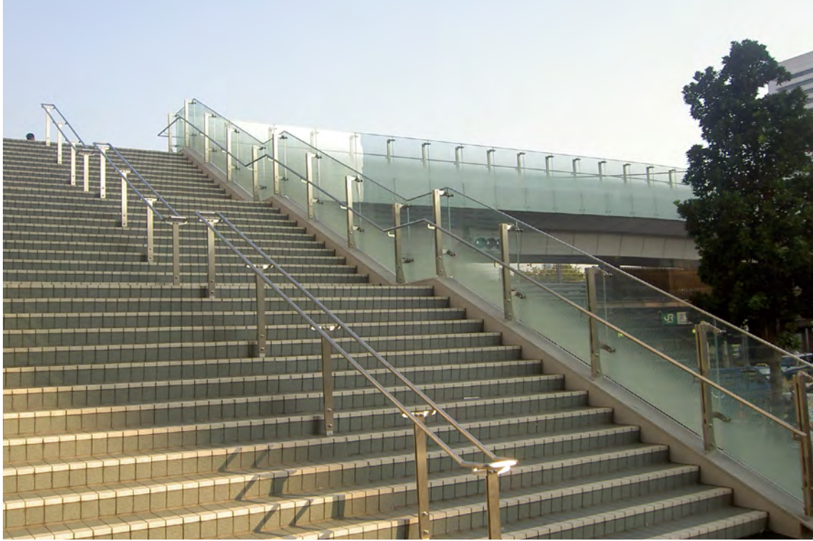
浜松町駅ペDESTリアンデッキ