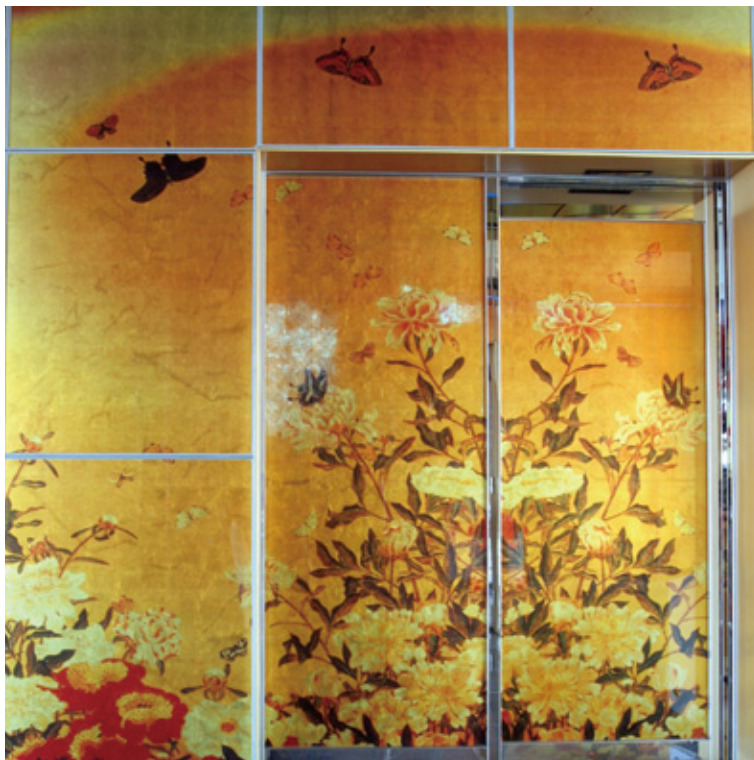
江の島アイランドSPA